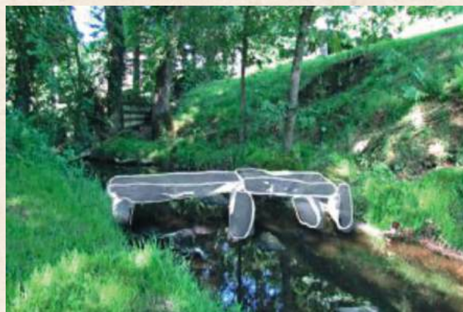
Le pont Romain sur la Dive (Chambornière)